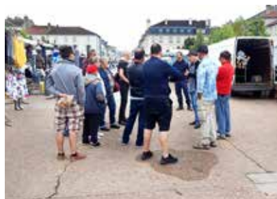
Les commerçants du marché de la place Léopold à Lunéville s'engagent pour la réduction des déchets en triant les cartons