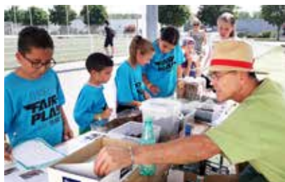
Journée du Fair Play, organisée par l'association MARIE, le 23 juin au stade des Frères Heckler à Lunéville

Au sein de votre entreprise, de votre association ou à la maison, faites appel aux deux ambassadeurs du tri Veolia, ils vous aideront à trouver des solutions de réduction des déchets.