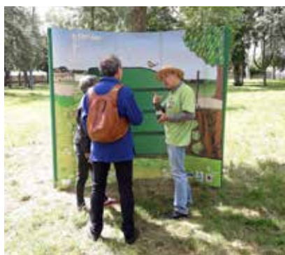
Formation sur le compostage au Château de Lunéville, le 9 juin : 500 personnes sensibilisées